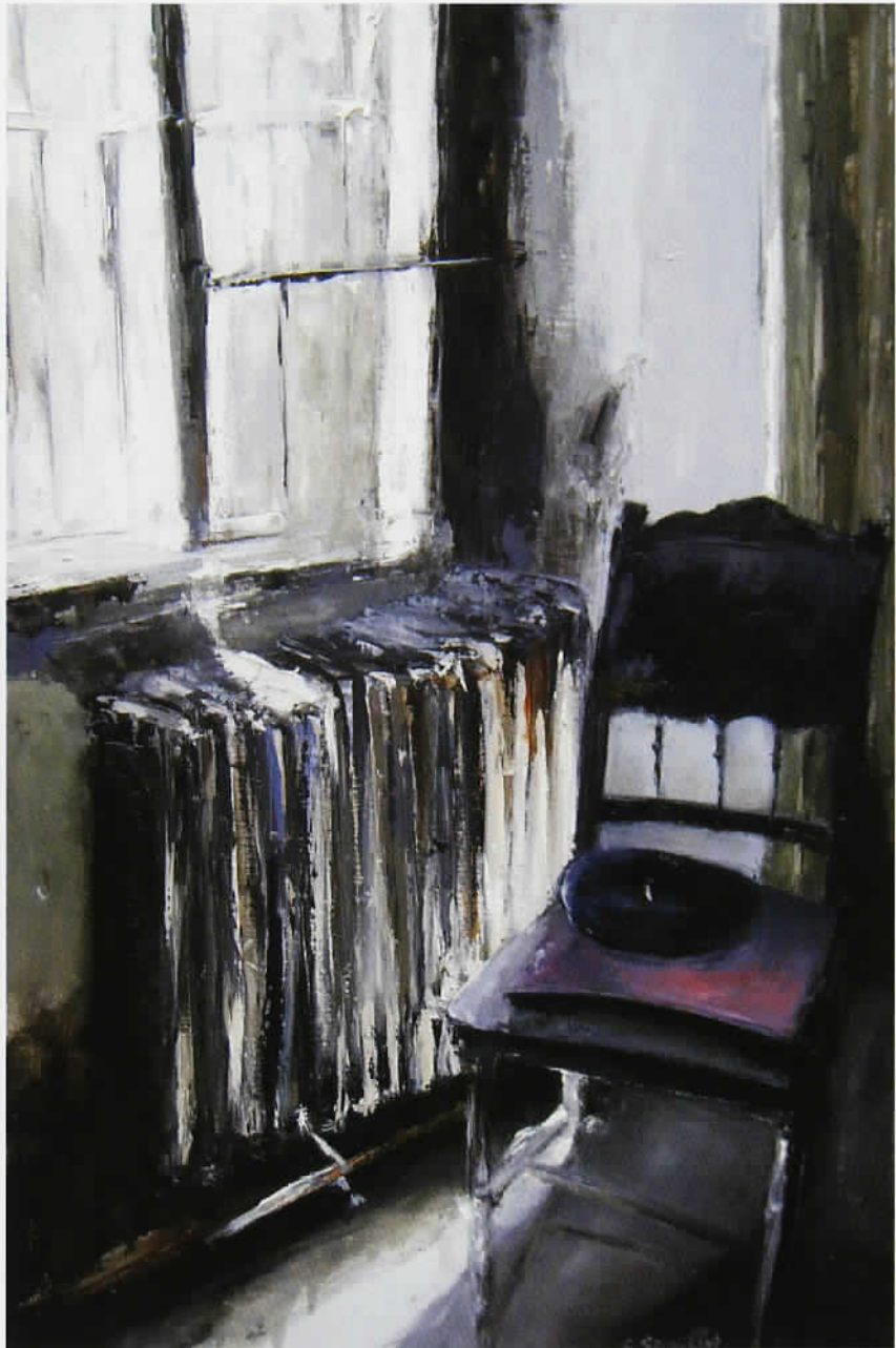
Le beret 80 x 120 cm