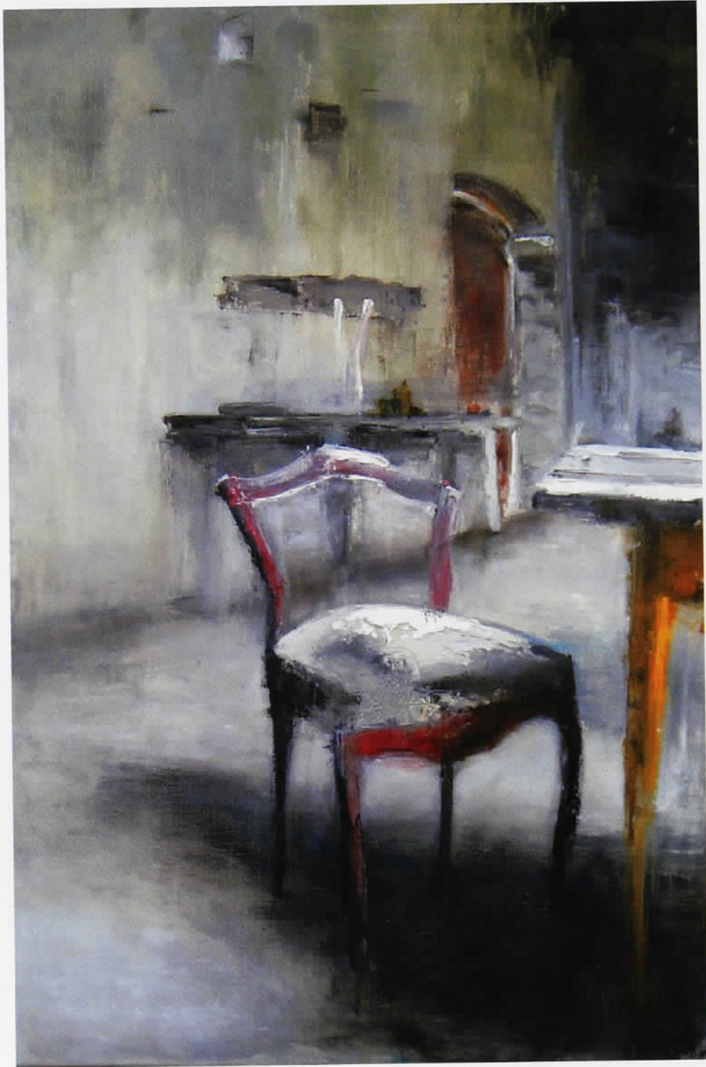
La grange 80 x 120 cm