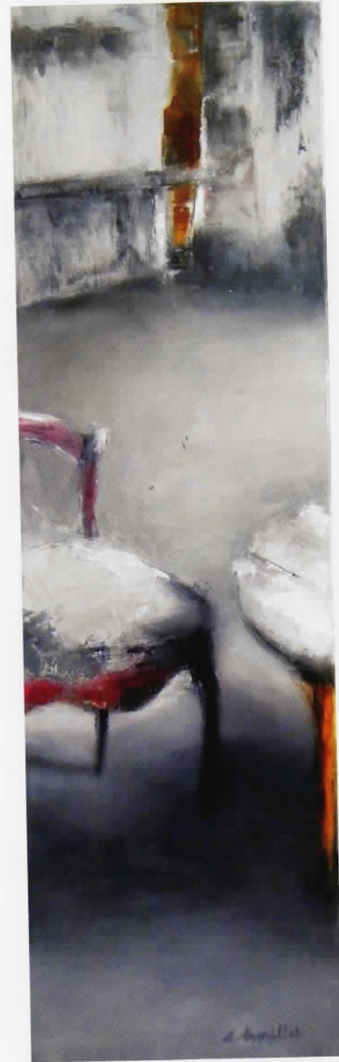
La table 30 x 100 cm