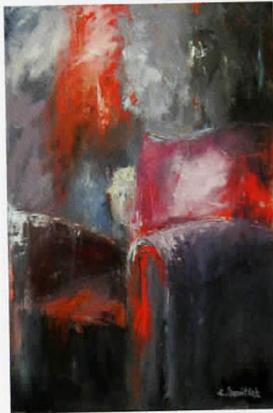
Brindezingue 80 x 120 cm